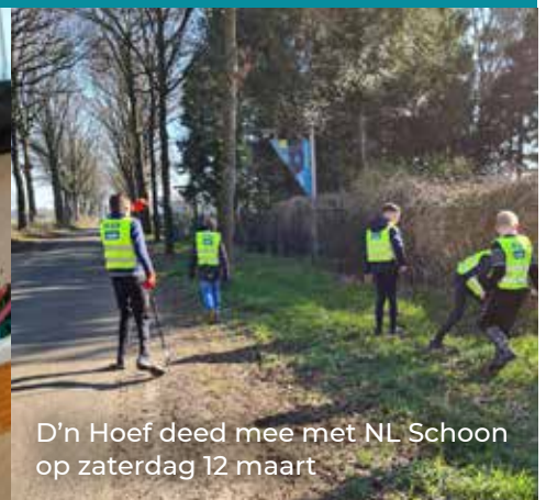
D'n Hoef deed mee met NL Schoon op zaterdag 12 maart