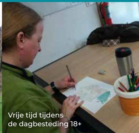
Vrije tijd tijdens de dagbesteding 18+