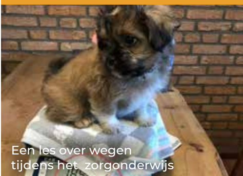
Een les over wegen tijdens het zorgonderwijs