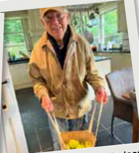
Verse hoefoogst appels door dagbesteding