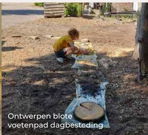
Ontwerpen blote voetenpad dagbesteding