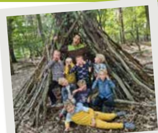
Gekke bekken in de BSO

Onze studenten worden uiteraard gecoacht en begeleid op de werkvloer. Daarnaast hebben ze eens per maand een studenten studietoets waarin extra kennis wordt gedeeld over D'n Hoef en inhoud van de functie pedagogisch medewerker op D'n Hoef. Regelmatig hebben ze met hun stagebegeleider stagegesprekken over reflectie of schoolopdrachten. Studenten mogen ook deelnemen aan de studiedagen voor personeel op D'n Hoef. Er zijn hier al veel studenten die van hun stage hier daarna hun baan hebben kunnen maken!