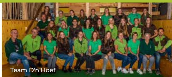
Team D'n Hoef