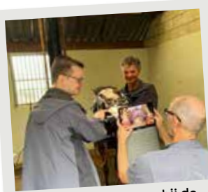
De paardentandarts bij de WMO groep

Via een aantal meetmomenten kunnen wij de resultaten van de zorg aan alle cliënten bijhouden. Dit is bij intake, bij elke evaluatie (halfjaarlijks) en bij het stoppen op D'n Hoef. Wij zullen u op bovengenoemde momenten uitnodigen om deze lijst, Vanzelfsprekend genaamd, in te vullen. Het meten van resultaten in de jeugdzorg is een landelijke verplichting en we hopen dat iedereen hier gehoor aan geeft.