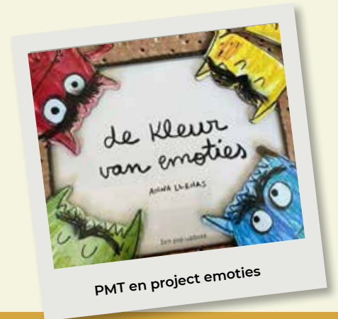
PMT en project emoties

Op 3 oktober stond er weer een workshopochtend voor verwijzers gepland. Er was een mooie opkomst door van verwijzers uit Geldrop-Mierlo, Waalre, Laarbeek en Helmond! Zij zijn nu op de hoogte van de verschillen tussen beide hulpverleningstrajecten.