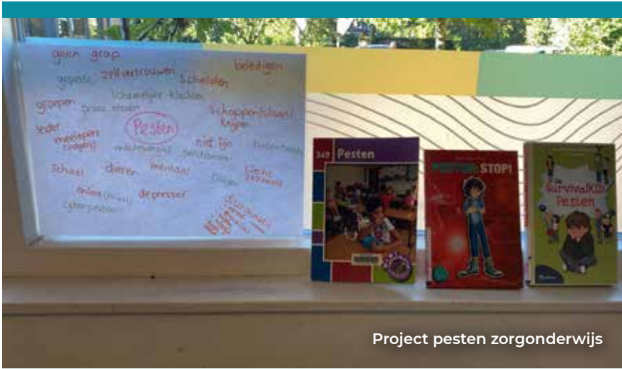
Project pesten zorgonderwijs